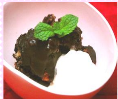
*チョコレートファッジプディング*

深めのお皿に盛り付け、生クリームを泡立てて出来上がり♪あつあつで甘いチョコと冷たくて甘くないチョコが絶妙に合います♪