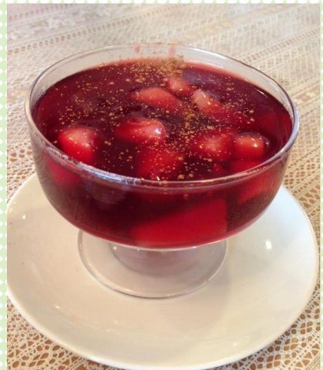
*マサモラ・モラーダ* (MAZAMORRA MORADA)

紫色の甘酸っぱいゼリーといった感じで、フルーツや スパイスが入り、トウモロコシで作られているとは思え ない不思議な食感ですが、さわやかな味でした。